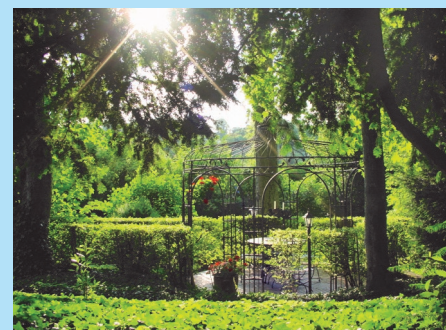
« la Vasconia » 3 chambres d'hôtes