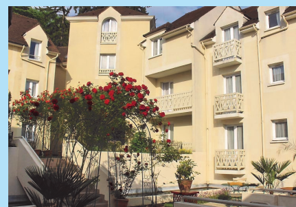
Hôtel « la Villa des Impressionnistes »****