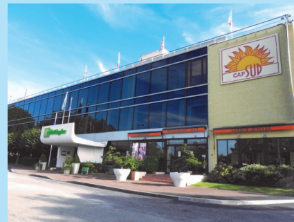
Hôtel Holiday Inn ****