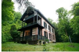
Datcha d'Ivan Tourguéniev

Non accessible aux personnes à mobilité réduite