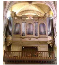
Orgue Cavallé-Coll-Mutin restauré en 2015

Eglise et orgue classés au titre des Monuments Historiques