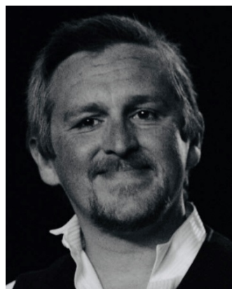
J-Baptiste Compiègne est... Eugène Manet