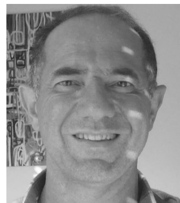
Marcel Levy est... Jean-Baptiste Corot