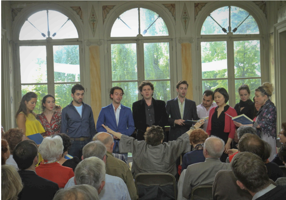
Concert de 2009 à la Villa Viardot- Les Noces de Figaro.

avec tous les participants de la «classe de maître» de Teresa Berganza