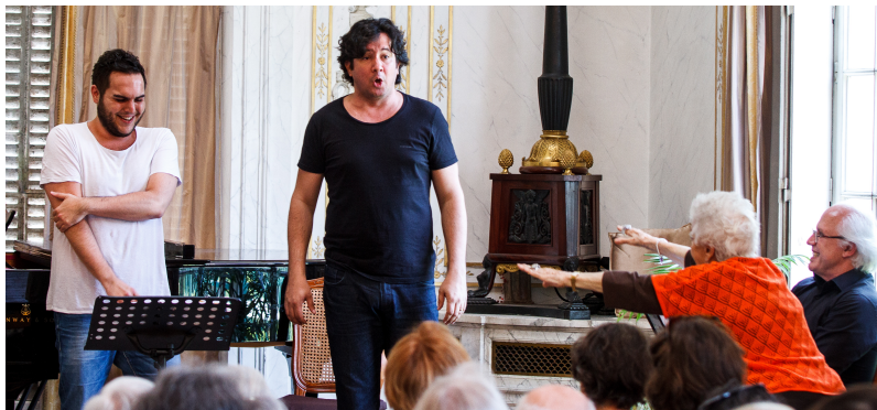
Masterclass 2016 - La Cenerentola