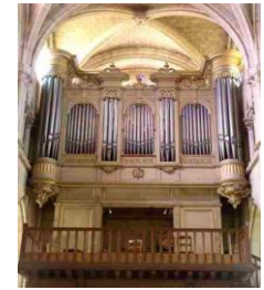
Orgue Cavaillé-Coll -Mutin restauré en 2015

Eglise et orgue classés au titre des Monuments Historiques