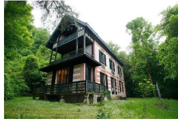
Datcha d'Ivan Tourguéniev

Moyen d'accès : Bus RATP 259 La Chaussée-Tourgueniev