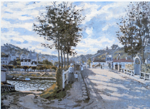
Claude MONET Le pont de Bougival 1869-1870