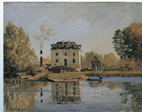
Alfred SISLEY Fabrique pendant l'inondation 1873